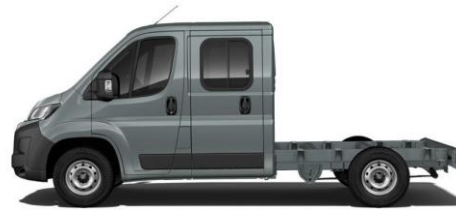
THUNDER GRAU P02B 350,00 (416,50)