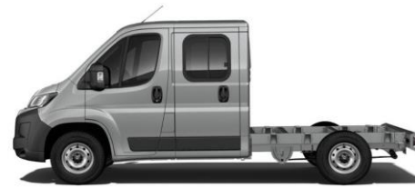
STAHL (ARTENSE) GRAU M0F4 700,00 (833,00)