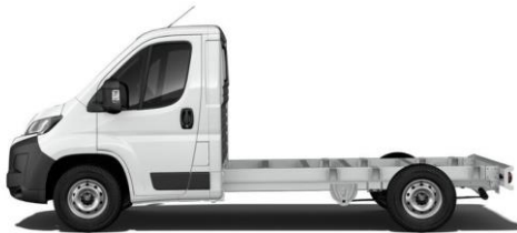
WEISS POPR 0,00 (0,00)