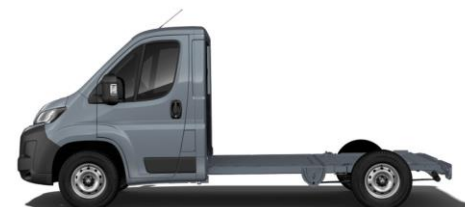
EISEN GRAU M0ZW 700,00 (833,00)