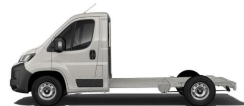
EXPEDITION GRAU P04K 350,00 (416,50)