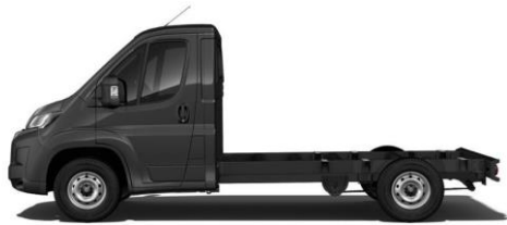
GRAPHIT GRAU M0E9 700,00 (833,00)