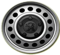
16" Stahlfelge Serie

Bei elektrisch anklappbaren Außenspiegel ist das Außenspiegelgehäuse Schwarz.