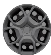
17" Full Cover Felge (ZHYY)